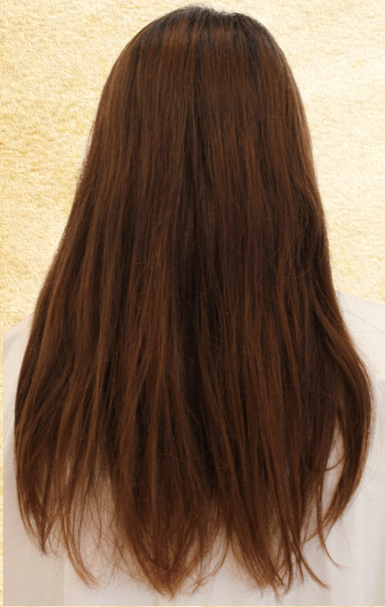
before (ダメージを受けた髪)